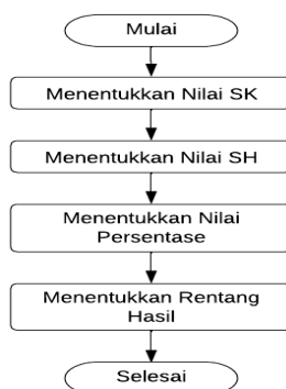
Gambar 1 Flowchart Metode Tam